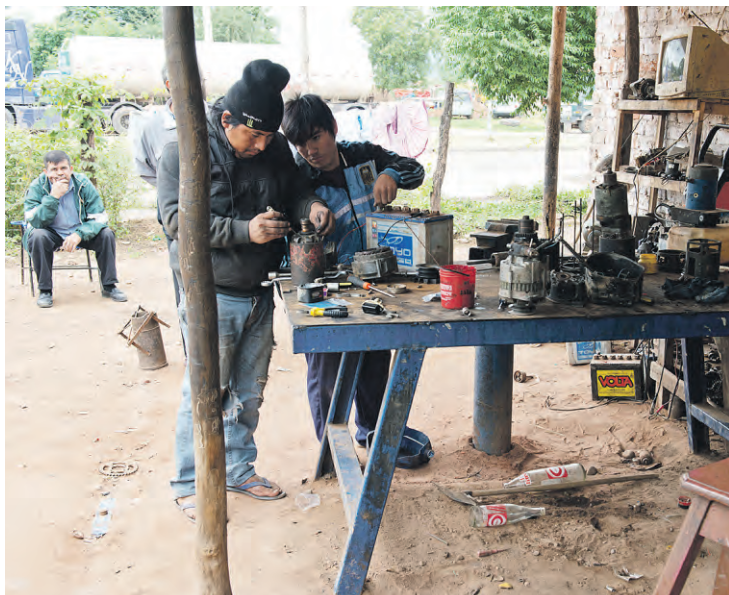
Die kaputte Lichtmaschine wird repariert – links hinten am Sessel schaut der Buschauffeur gespannt zu.

Als es schließlich hell wurde, waren wir noch Stunden damit