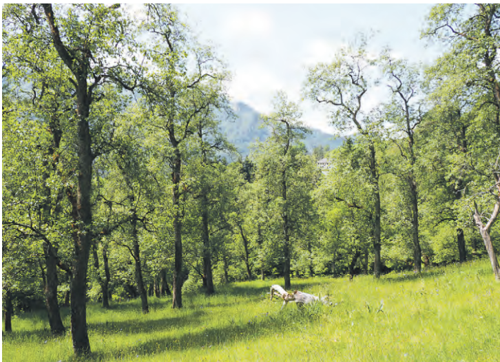
Der Baumgarten bei der Haubenleithen, einem der aufgelassenen Höfe auf der Steinbacher Sonnseite – und früher eine Station beim Gang über die Berge.

Wald gabs nur wenig auf der Steinbacher Sonnseite. Dafür hat der Steinbach drunten im Tal seinem Namen alle Ehre gemacht: Der beansprucht als Wildbach weite Teile des Talgrundes. Aus den tief eingeschnittenen Seitengraben kommen Stämme, Geröll, Schlamm – mit jedem Hochwasser und bei der Schneeschmelze.