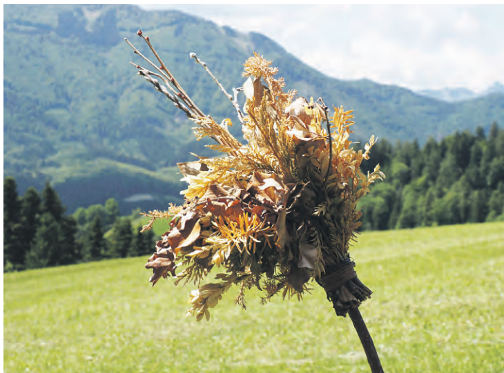
Die Palmbüsche beim Unterperneck (Foto) und beim Oberthiergraben, die wachen heut über Wiesen und Weiden. Vor dreihundert Jahren liegen um diese Höfe noch Felder – weit droben am Berg.