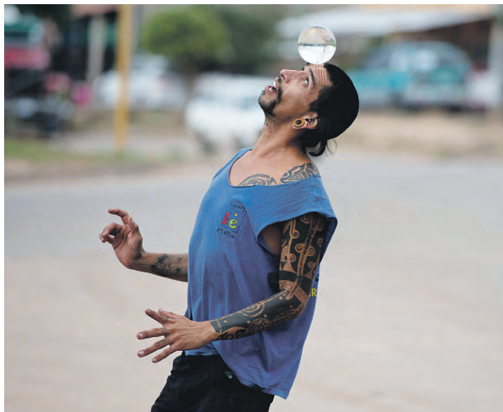
Der Argentinier überbrückt die Wartezeit und führt beeindruckende Kunststücke mit seiner Glaskugel vor.