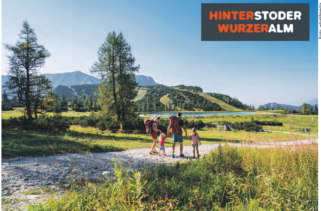
Auf der Höss in Hinterstoder warten atemberaubende Panoramablicke und zahlreiche Wanderwege – von gemütlich bis anspruchsvoll.

Infos über Betriebszeiten der Liftanlagen auf Höss und Wurzeralm gibts auf www.hiwu.at