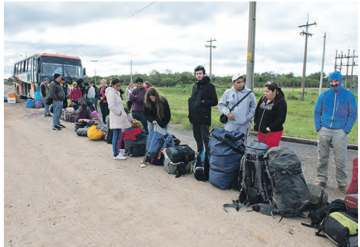
Der Zöllner lässt uns an der Grenze zu Paraguay warten, bis seine Frau alle Getränke und Torten verkauft hat.

beschäftigt, den Bus aus dem Straßengraben zu schieben und dann fahren wir weiter an die Grenze.