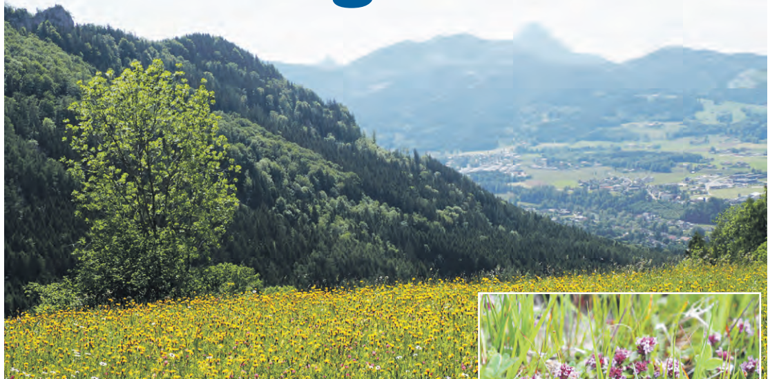
Oben: Blick vom Hamberg ins Almtal – links das Maienköpferl, rechts Mühdorf, dahinter der Traunstein. Der wilde Thymian (rechts), das „Kuttikraut“, wächst auf den Weiden unterhalb des Perneckerkogels.

Die aufwendigen Prozessionen über die Berge, ins Rath und nach St. Wolfgang liegen wohl mit gutem Grund rund um