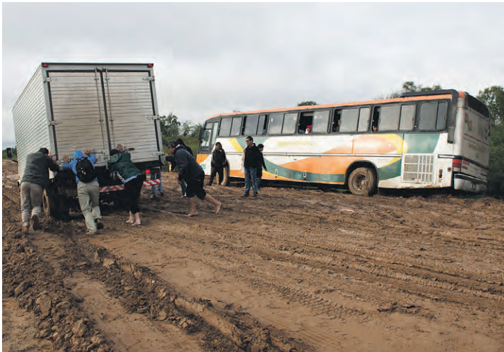
Unser Bus steckt im Schlamm fest, während wir einem vorbeifahrenden LKW anschieben.