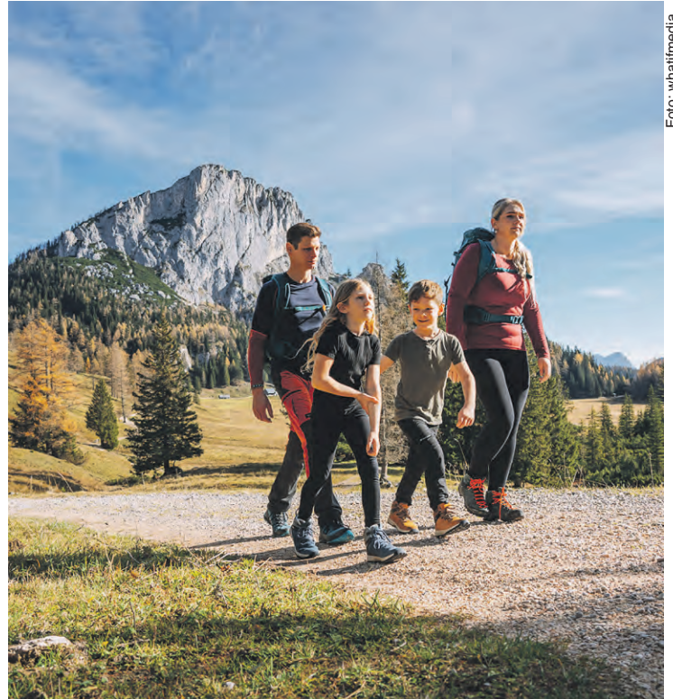
Wanderwege, idyllische Almen, urige Hütten und beeindruckende Naturerlebnisse machen die Wurzeralm zum perfekten Ausflugsziel für die ganze Familie.