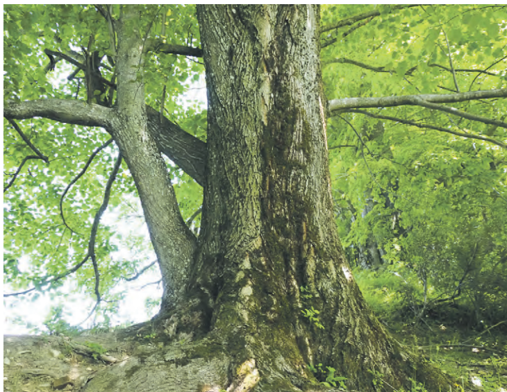
Linden am alten Hohlweg vom Oberperneck ins Unterperneck.