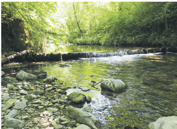
Der Steinbach nahe der Weitenau – hier hat die Prozession um 9 Uhr in der Früh gerastet. Der Bach ist erst seit der Regulierung vor etwa siebzig Jahren so tief eingeschnitten.