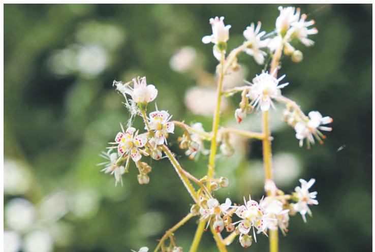
Vielleicht ist es den Wallfahrern auch vor dreihundert Jahren schon aufgefallen – das Porzellanblümchen, das aus dem Schlossgarten der Seisenburg entkommen ist. Auf der Seisenburger Wiese hielten sie jedenfalls Rast.